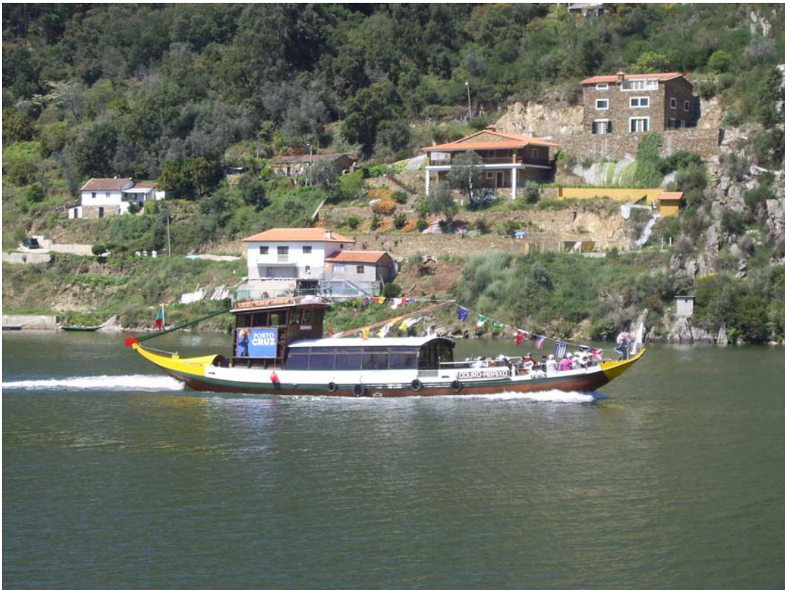
Fig.2 – Barco Rabelo a navegar no Douro