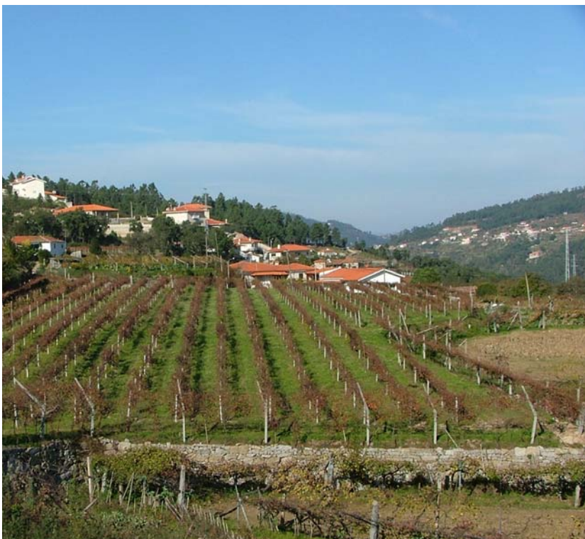
Fig.3 – Vinha Reestruturada