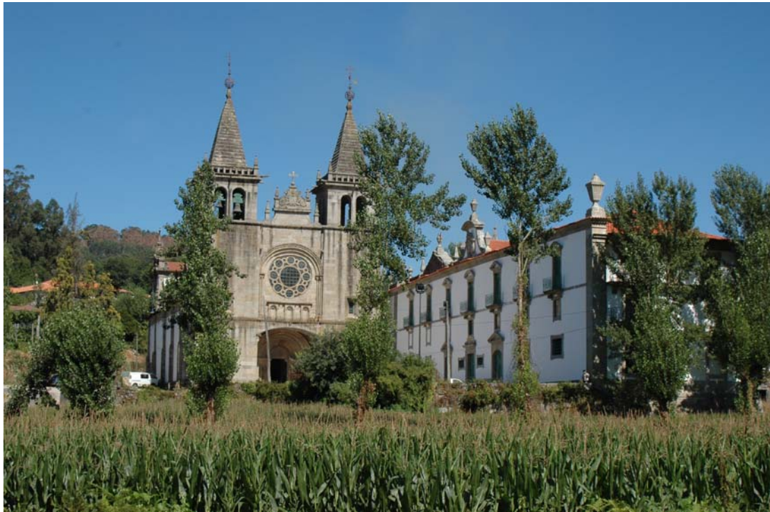
Figuras n.º 15 - Fotografia da vista geral do alçado principal do Mosteiro de Pombeiro e Ribavizela.

O mosteiro encontra-se em meio rural, isolado, como marco de referência na paisagem, a envolvente é em forma de vale, devendo por isso haver um plano de pormenor, na base do que já foi referido anteriormente para a zona, de modo a manter as características arquitectónicas e paisagísticas do lugar.