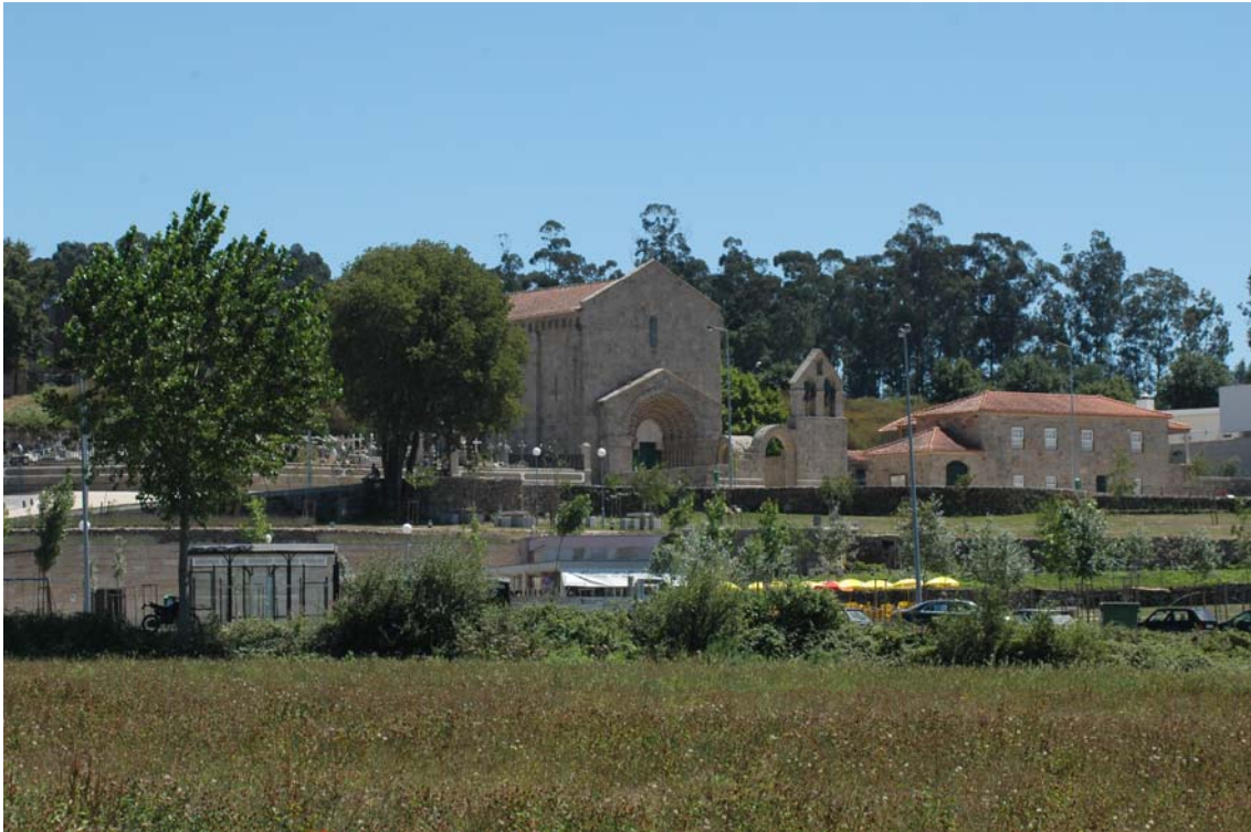
Figura n.º 10 – Fotografia geral da Igreja de São Pedro de Ferreira.