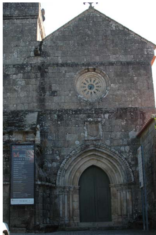
Figuras n.º 3 e 4 - Fotografias dos alçados da Igreja de S. Pedro de Cête.