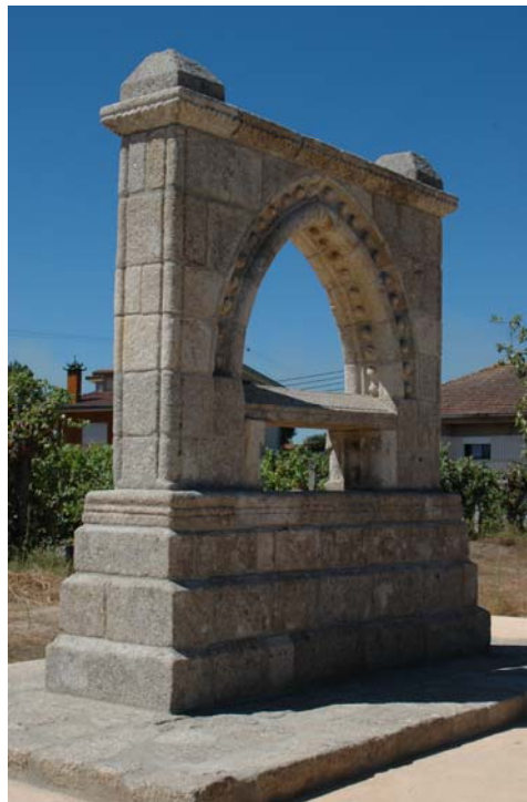
Figuras n.º 8 e 9 - Fotografias dos alçados do Memorial da Ermida.