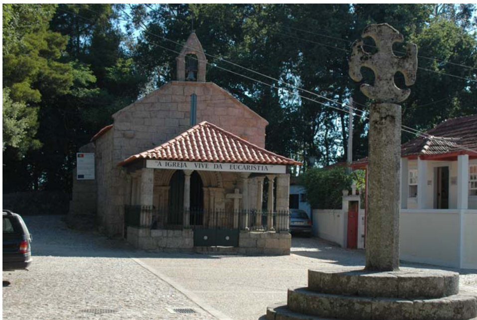
Figura n.º 5 - Fotografia da Ermida da Nossa Senhora do Vale de Cête.

Esta Ermida está classificada com imóvel de interesse público, Decreto-Lei 37728, de 5 de Janeiro de 1950.