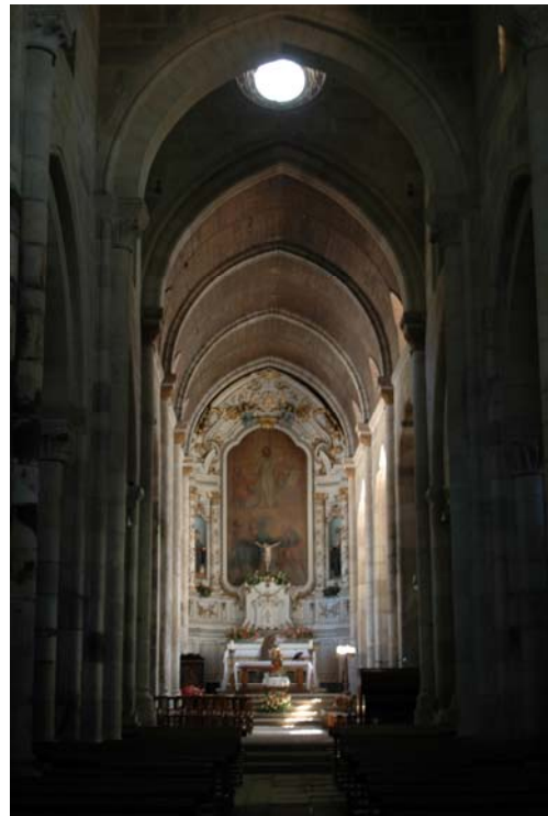
Figuras n.º 6 e 7 - Fotografias do alçado principal e nave central da Igreja de São Salvador de Paços de Sousa.