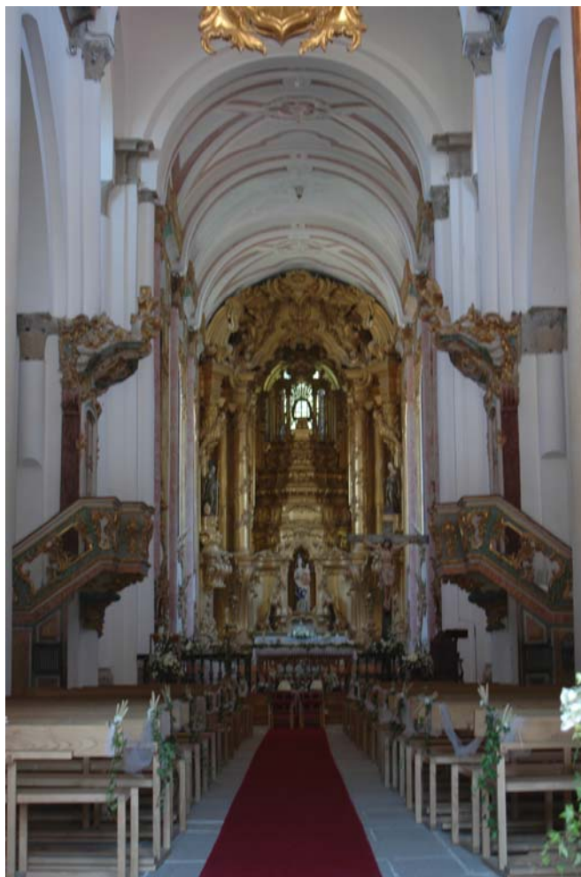
Figuras n.º 13 e 14 - Fotografias do alçado principal e nave central do Mosteiro de Pombeiro e Ribavizela.

O monumento foi classificado de monumento nacional, Decreto-Lei 16-06-1910, de 23 de Junho.