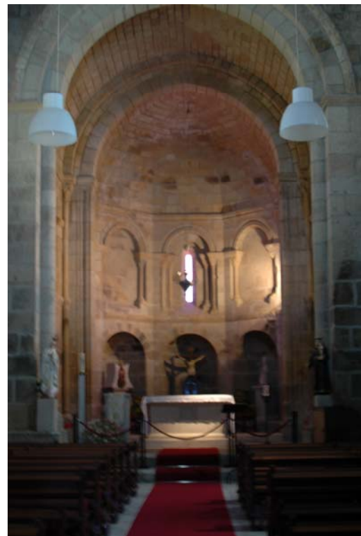
Figuras n.º 11 e 12 - Fotografias do alçado principal e nave central da Igreja de da Igreja de São Pedro de Ferreira.