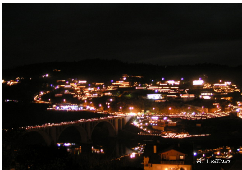
Figura nº 14 – Aspecto de Entre-os-Rios na noite da Procissão

Outro ponto alto em Entre-os-Rios, é a procissão das velas (Endoenças). “Trata-se de um evento de turismo religioso ímpar no nosso país, no qual 41 mil tigelinhas iluminam as ruas, as casas e os rios Douro e Tâmega, na noite de Quinta-Feira Santa, criando um cenário único e inesquecível”, (Junta de Turismo de Entre-os-Rios). A Procissão das Endoenças, que se realiza há cerca de 300 anos, sai, ao anoitecer, da igreja paroquial de Santa Clara do Torrão, no Marco de Canaveses. O cortejo religioso encaminha-se, depois, para Entre-os-Rios, no concelho de Penafiel, onde tem lugar o "Sermão do Encontro", entre Jesus Cristo e Nossa Senhora das Dores.