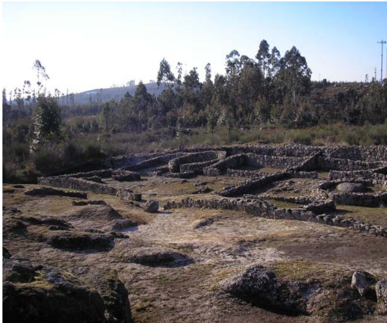
Figura nº4 – Castro no Monte do Mozinho

história, que tem muita procura turística tanto pelo castro em si, como também pela posição geográfica em que se encontra, onde proporciona belas paisagens oferecidas pelo próprio ordenamento do Território.