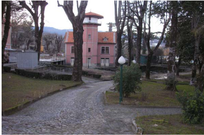
Figura nº 7 – Balneário das Termas de S. Vicente