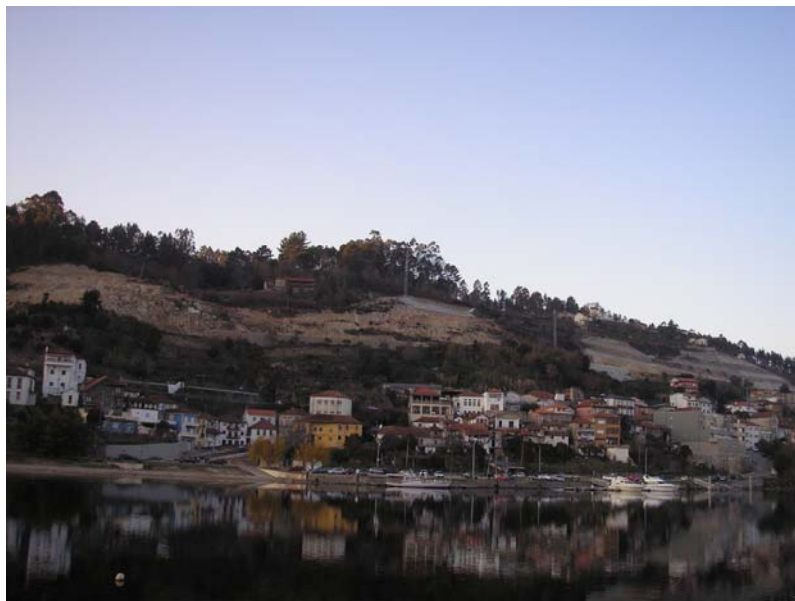
Figura nº 12 – Entre-os-Rios

Após uma visita detalhada destes monumentos do Românico, é sempre interessante terminar o passeio junto a Entre-os-Rios, onde é possível observar toda a beleza que a Natureza nos proporciona.