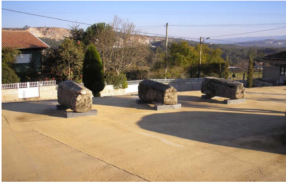
Figura nº 6 – Arcas Sepulcrais