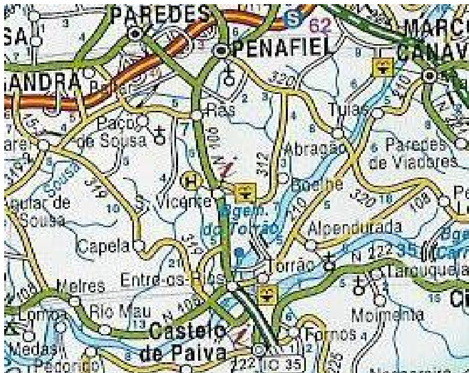
Figura nº 2 – Eixo da Nacional 106

Por todas estas características, que o território do Vale do Sousa oferece fez-se uma análise sobre a Nacional 106, entre Penafiel e Entre-os-Rios, onde se pretende realçar todos os pontos de interesse turístico aliado à gestão do território. Esta análise pode ter como base a pretensão de ser um “Roteiro Turístico” dentro do próprio Vale do Sousa, onde os turistas podem num fim-de-semana, aproveitar toda a beleza que esta zona de Penafiel pode oferecer, dentro do contexto da já referida Rota do Românico.