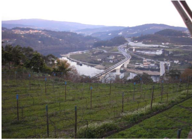
Figura nº 11 – Paisagem que se vislumbra da igreja da Eja