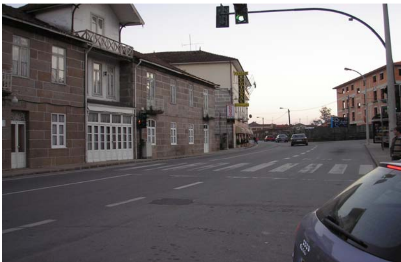
Figura nº 8 – Aspecto das adegas típicas

Mas enquanto se aguarda a sua reabertura, que já é um dado adquirido, deve-se aproveitar os magníficos petiscos que existe por estas paragens, nas adegas típicas da região.