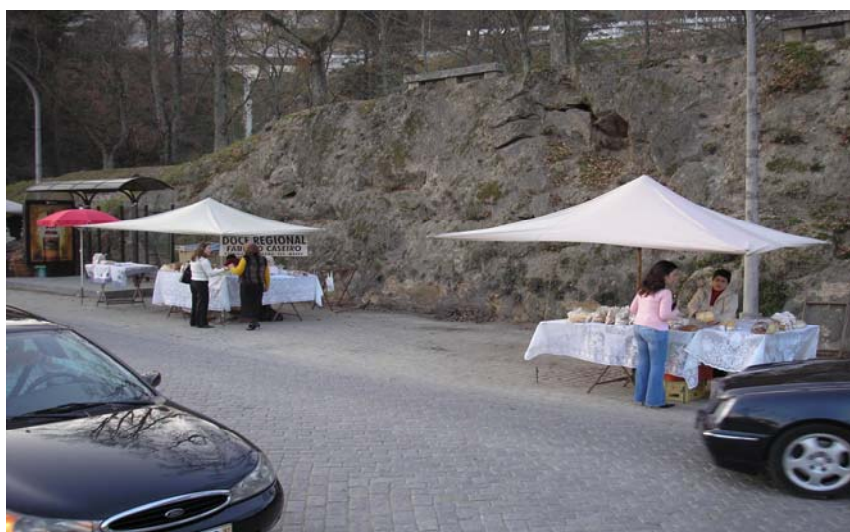
Figura nº 13 – Barracas de doces regionais

Não deixando de ser um ponto de interesse turístico. Hoje, continua a ser um local de passagem, onde as pessoas gostam de parar junto das barraquinhas que lá existem. Para saborear os doces regionais (figura nº12) de fabrico caseiro, como o pão “amarelo”, as cavacas e os “rosquilhos”, sendo estes um grande marco de referência nesta zona.