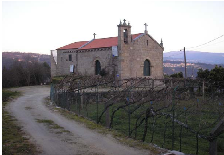
Figura nº 10 – Igreja da Eja

Mais abaixo podemos, podemos vislumbrar a igreja de S. Miguel de Entre-os-Rios, na Freguesia da Eja, encontra-se em meio rural, no cimo de uma plataforma rochosa elevada, dominando uma vasta panorâmica sobre a paisagem circundante, incluindo os Rios Douro e Tâmega.