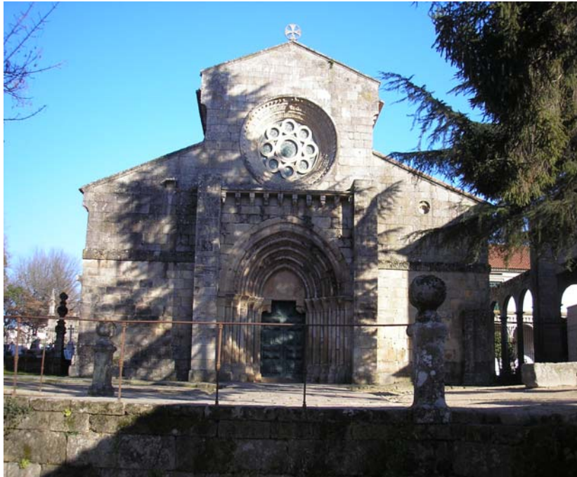
Figura nº3 – Mosteiro de Paço de Sousa