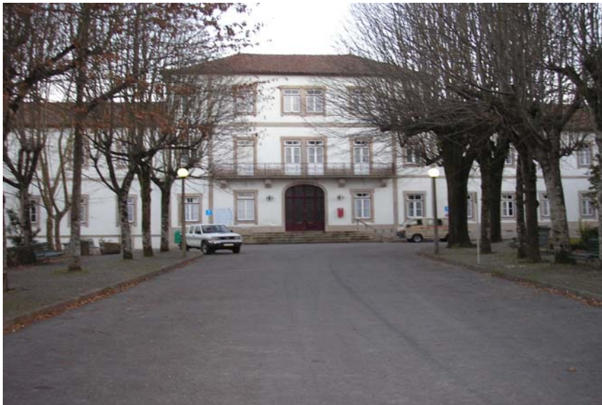
Figura nº 9 – INATEL

Dentro da propriedade existe O Centro de Férias, que se encontra rodeado por um parque arborizado, sereno e verdejante, proporcionando um descanso e lazer únicos e uma óptima alternativa ao afã citadino. As termas, outrora frequentadas por Ramalho Ortigão, são procuradas por quem deseja aliar a doçura da natureza à mais eficaz terapia, ( www.esec-alfredo-silva.rcts.pt ).