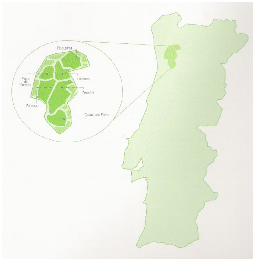
Figura nº1 – Localização Geográfica do Vale do Sousa

O Vale do Sousa congrega os concelhos de, Castelo de Paiva, Felgueiras, Lousada, Paços de Ferreira, Paredes e Penafiel. Os seis concelhos integram um conjunto de 144 freguesias, que abrangem uma área de 767,1km 2 , representando 3,6% do total da região Norte. Onde residem 327.808 habitantes, cerca de 9% da população da região Norte, o que implica uma densidade populacional de 427 habitantes por Km 2 .