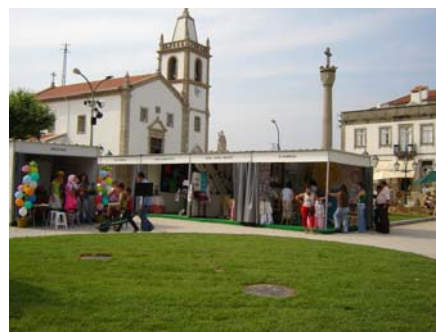
Foto 6 – Feira do Vinho Verde, do Lavrador, Gastronomia e Artesanato (1 de Julho de 2006)

Relativamente ao Posto de Turismo, este foi criado no ano de 1990, estando sobre a posse da Região de Turismo Rota da Luz 13 . Este encontra-se situado na Vila de Sobrado 14 , no edifício do antigo estabelecimento prisional do concelho.