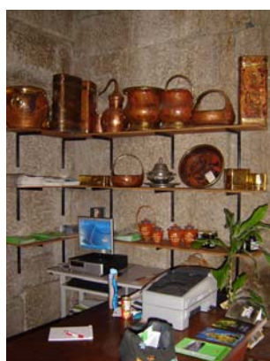
Fotos 7 e 8 – Posto de Turismo de Castelo de Paiva (12 de Setembro de 2006)

Em todos estes processos de comercialização o preço é sempre estipulado pelo próprio artesão. Estes estipulam um preço que permita a comprar do artefacto, não tendo em conta o material e o tempo gasto no processo de produção pois assim ninguém o compraria.