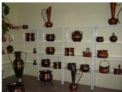
Fotos 4 e 5 – Espaço de venda de um artesão (6 de Setembro de 2006)

Relativamente às feiras quinzenais e anuais onde participam os artesãos, estas ocorrem no Concelho de Castelo de Paiva e noutros concelhos limítrofes: Cinfães, Arouca, Marco de Canavezes, entre outros. Estas feiras foram o primeiro meio de comercialização exterior utilizado pela maioria dos artesãos.