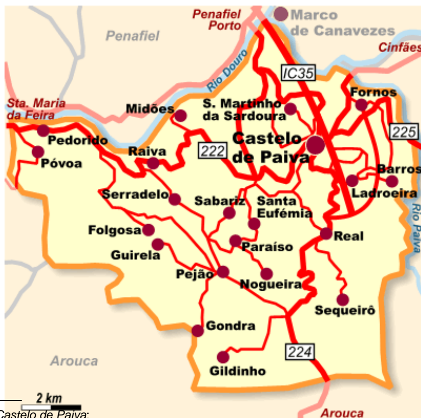
Mapa 2 – Concelho de Castelo de Paiva 19