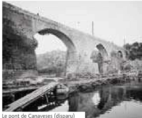
Le pont de Canaveses (disparu)

Le pont de Canaveses semble en avoir remplacé un autre, de structure romaine, qui, à ce même endroit de la rivière Tâmega, assurait la connexion de Tongobriga (Marco de Canaveses) (p. 275) au littoral. Cependant, son importance est surtout été récupérée au Moyen Âge. Le pont était une alternative au voyage en bateau le long du fleuve Douro jusqu'à la ville de Porto. La route qui reliait l'arrière-pays du Douro à la côte de l'Atlantique traversait la rivière Tâmega à Canaveses et s'embranchait à Penafiel sur l'ancienne route Amarante-Porto. De part et d'autre du pont sont nées deux paroisses, elles assuraient le confort spirituel des habitants du bourg, situé sur la route entre les rives.