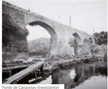
Ponte de Canaveses (inexistente)

A ponte de Canaveses parece ter substituído uma outra, de fábrica romana, que neste ponto do Tâmega assegurava a ligação de Tongobriga (Marco de Canaveses) (p. 275) ao litoral. Todavia, a sua importância foi recuperada e aproveitada, sobretudo ao longo da Idade Média. Sendo uma alternativa à viagem fluvial até ao Porto pelo Douro, a via que ligava o interior duriense à costa do atlântico, atravessava o Tâmega em Canaveses e entroncava em Penafiel na velha estrada de Amarante para o Porto. De um lado e