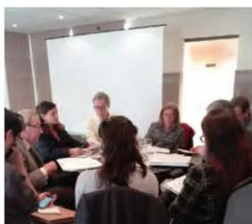
Grupo de trabalho realizado em Lisboa, para elaboração do documento “Conservação e Reabilitação do Património - Estratégias e Potencialidades