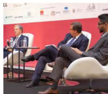
SRU Porto (15 de novembro de 2019)

A excelência é um objetivo a perseguir em todas as intervenções de conservação e restauro do património edificado.