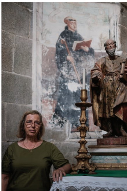
3 | Cuidadora do Mosteiro de Pombeiro.

Num contexto turístico bastante dinâmico e concorrencial, que aposta em novas experiências e serviços, a presença dos Cuidadores do Património, que de uma forma dedicada zelam pelos imóveis a seu cargo, torna a viagem pela Rota do Românico num momento único. ■