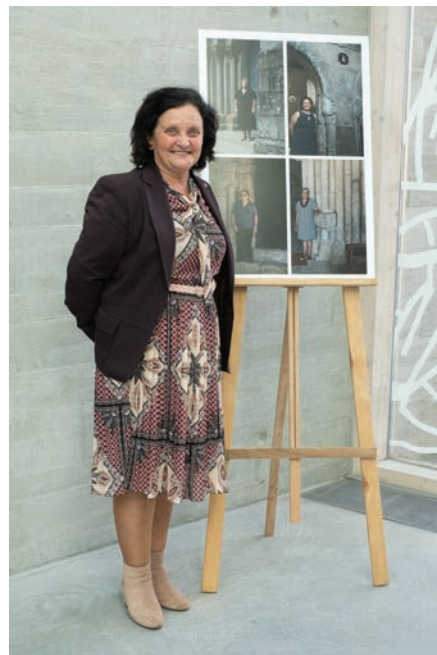
4 | Cuidadora da Igreja de Tarouquela.