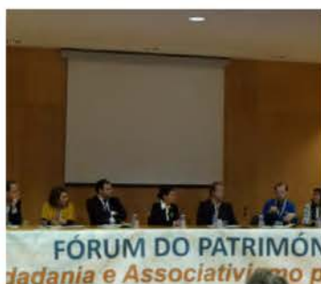
Fórum do Património 2019, em Aveiro

Contribuir para a melhoria do ordenamento e da regulação do setor da construção e para a mudança do seu papel na economia e na sociedade.