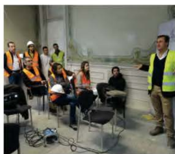
Visita “Estaleiro Aberto” à sede da Secção Regional Norte da Ordem dos Arquitetos