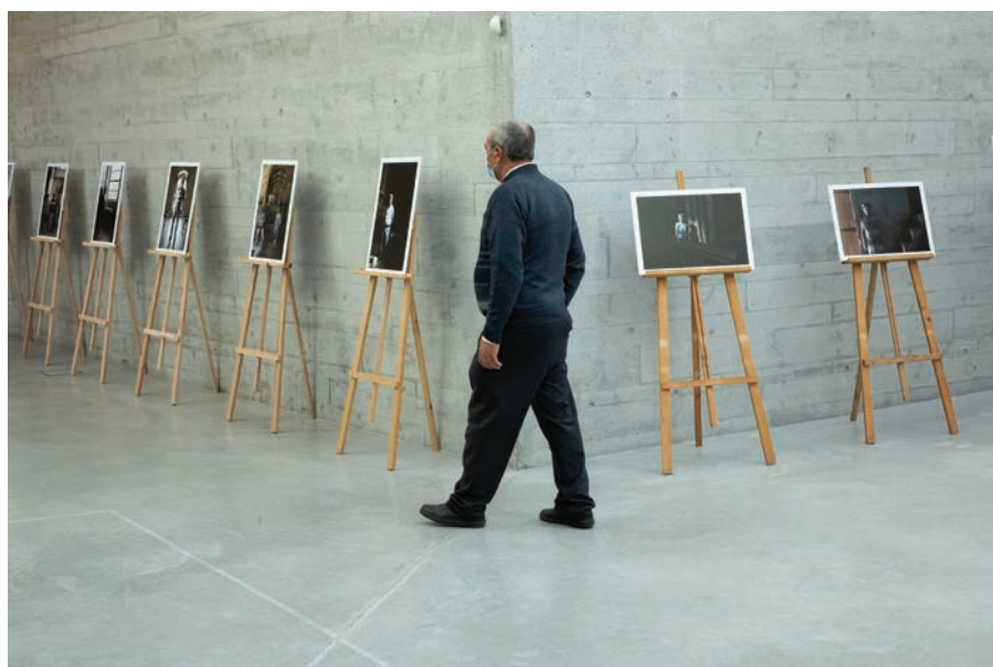
5 | Exposição Cuidadores do Património. Foto Luís Barbosa