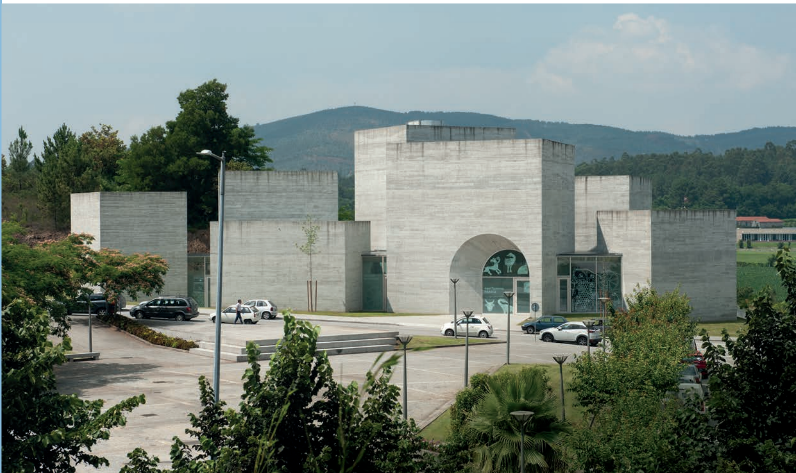
2 | Centro de Interpretação do Românico

Os cuidadores são pessoas atentas e, por vezes, as primeiras a alertar para o surgimento de problemas estruturais ou pontuais no edifício (Monteiro, 2022). Quando os visitantes vão em visita livre ao monumento, são eles que lhes dão as boas vindas em nome da Rota do Românico.